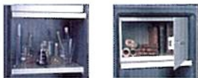
Equipements intérieurs (en partant de la gauche) : tablette, armoire à clé